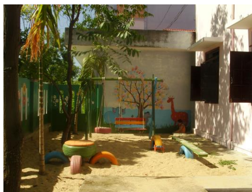
Nouvelle aire de jeux

Durant la période estivale, l'école a bénéficié de travaux de rénovation ; les enseignantes ont profité de formations complémentaires et d'une journée « Team Building » avec leurs collègues du Village de BVN et de l'orphelinat Duc Son